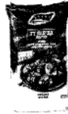
דג: יכון להכניס קציצות דג (דלדג)

דגנים: בספטמבר דגנים 30% מלא ובהדרגה יעברו ל-50% מלא (צפי בנובמבר) ובהמשך נעלה ל-75%.