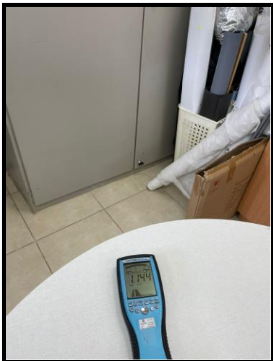
תמונה מס' 2- הערך המתקבל במרחק 100 ס"מ מחזית הלוח