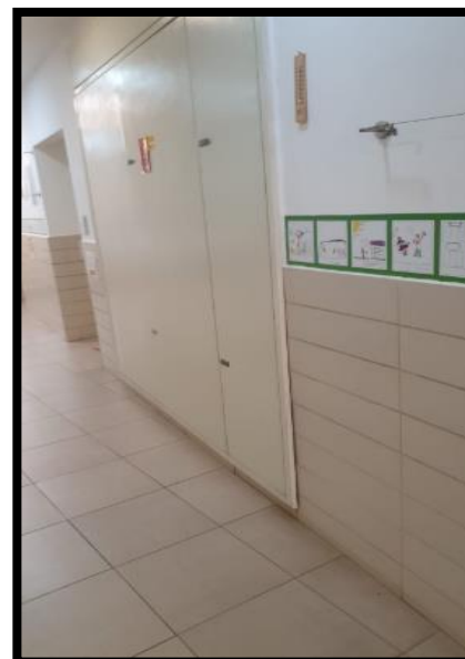
תמונה 1: חזית לוח ראשי פונה למסדרון הגב פונה למבואת מעבר