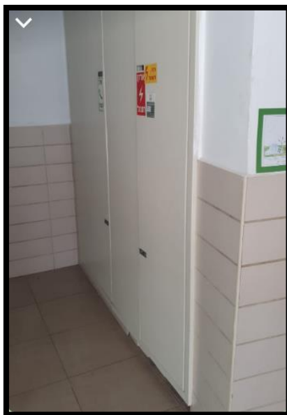
תמונה 2: חזית לוח חשמל משני פונה למסדרון הגב פונה למבואת מעבר