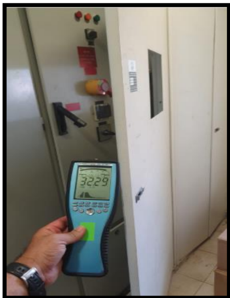
תמונה 3: הערך המתקבל בחזית לוח חשמל ראשי