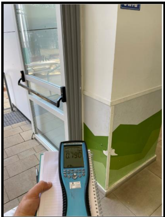
תמונה מס' 2-גב לוחות משנה גובלים בשירותים