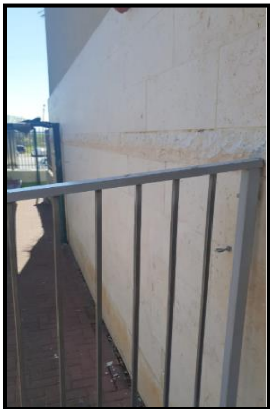
תמונה מס' 2: גב לוח חשמל גובל עם קיר מעטפת חיצונית