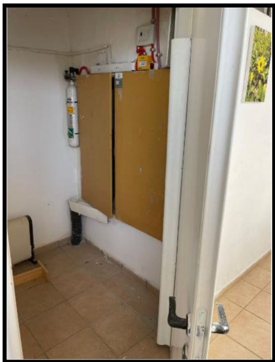
תמונה מס' 2-חזית לוח חשמל משני