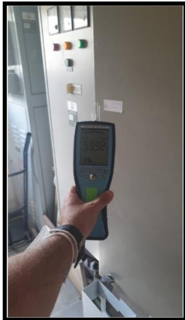
תמונה 2 חזית לוח שמל חדר חשמל