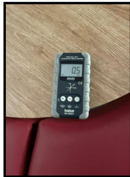
תמונה מס' 1: הערך המתקבל בכיתה ד' 1