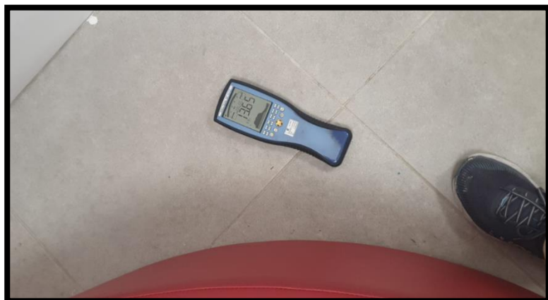
תמונה מס' 2: הערך המתקבל מעל לוח חשמל ראשי