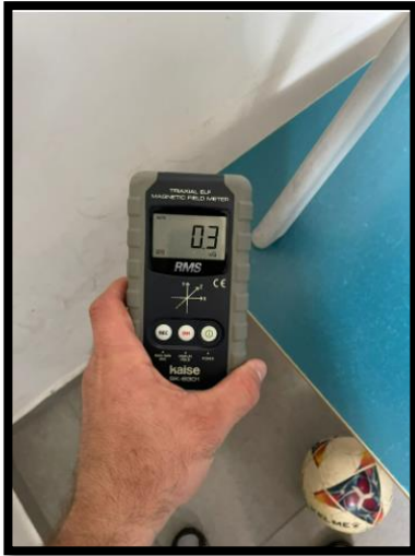
תמונה מס' 5: הערך המתקבל בגב לוח חשמל ראשי קומת קרקע