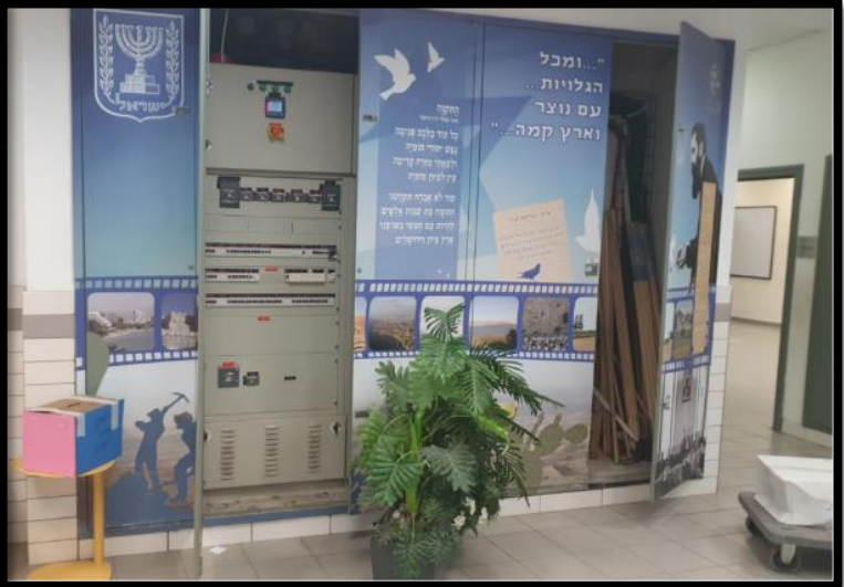
תמונה 4: לוח חשמל משני טיפוסי גובל עם קיר מעבר לממ"ד