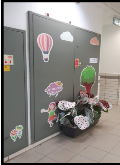
תמונה 3: לוח חשמל משני טיפוסי