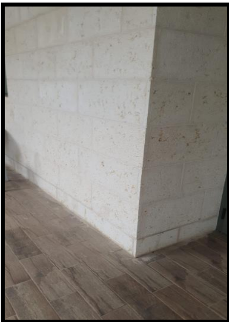
תמונה 6: גב לוח חשמל קומה-1 מבנה חדש פונה החוצה