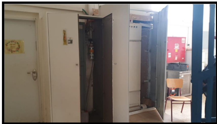
תמונה מס' 3: עוצמת שטף השדה המגנטי המתקבל בגב לוח חשמל במרחק 180 ס"מ עמדת מזכירה