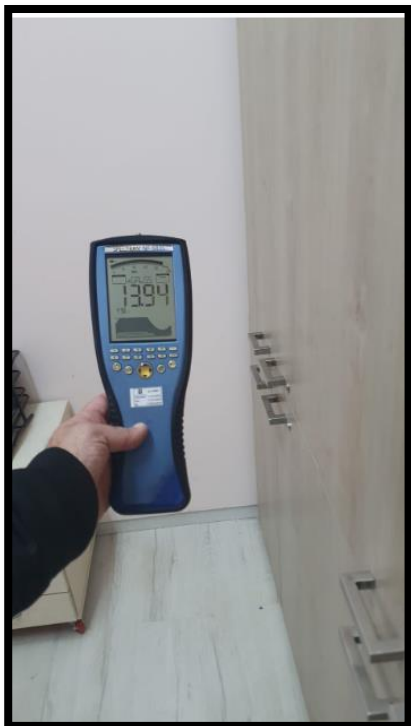
תמונה מס' 1: גב לוח חשמל ראשי גובל עם חדר מזכירות