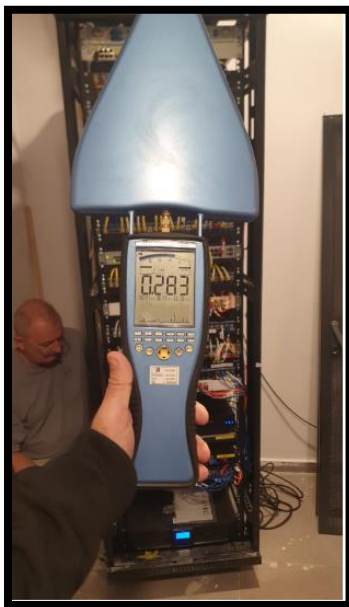
תמונה 4: הערך המתקבל חזית לוח תקשורת