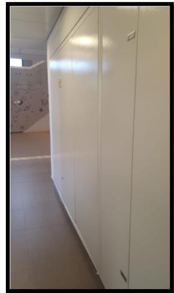
תמונה 1: חזית לוח חשמל ראשי