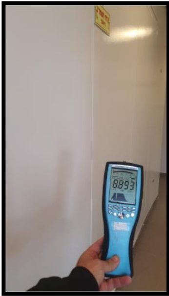
תמונה 2: הערך המתקבל בחזית לוח ראשי מעבר מסדרון