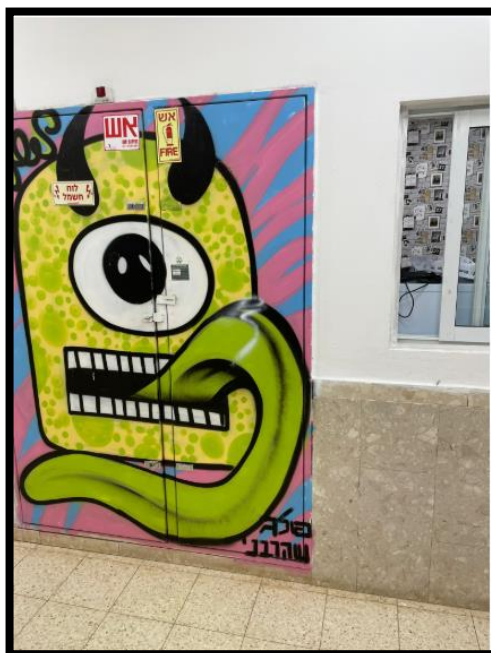
תמונה מס' 1- חזית לוח חשמל