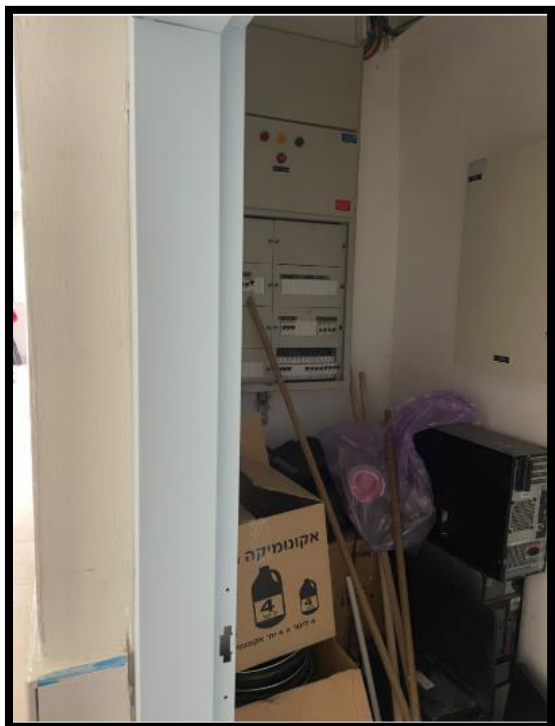
תמונה מס' 2-גב לוח משני גובל החוצה