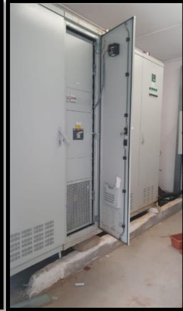
תמונה 1: חזית לוח חשמל ראשי בחדר חשמל