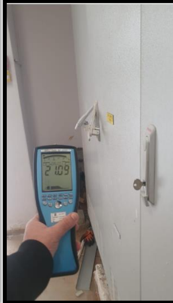
תמונה 3: הערך המתקבל בחזית לוח ראשי