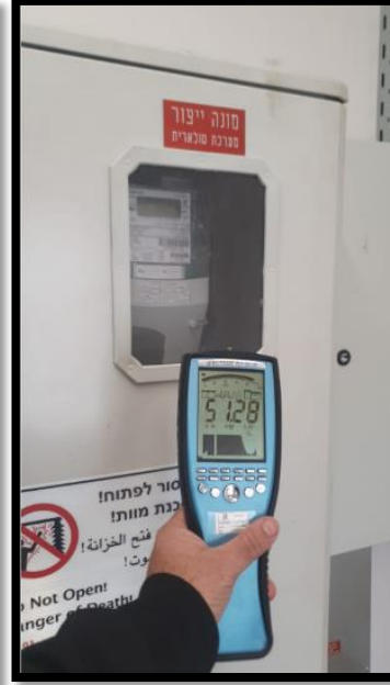
תמונה 2: חזית לוח מונה סולארי