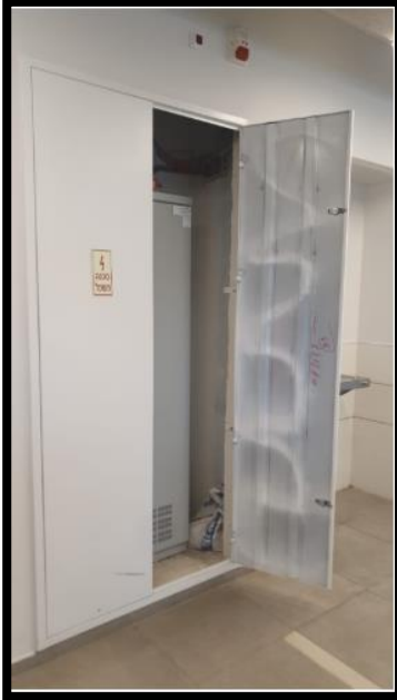
תמונה 4: חזית לוח חשמל משני טיפוסי קומתי