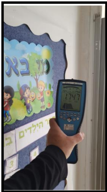
תמונה מס' 2-הערך המתקבל גב הלוח-מעבר