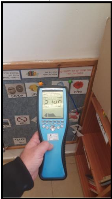
תמונה מס' 2-הערך המתקבל בגב לוח חשמל במרחק 30 ס"מ