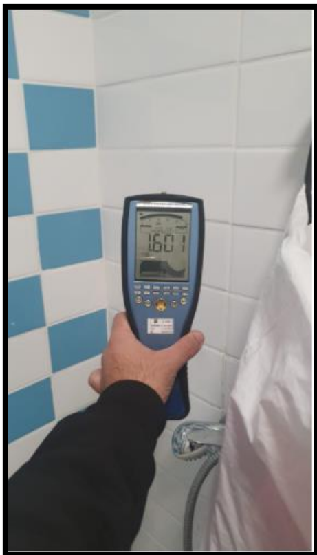
תמונה מס' 2-הערך המתקבל גב לוח חשמל מעטפת חיצונית