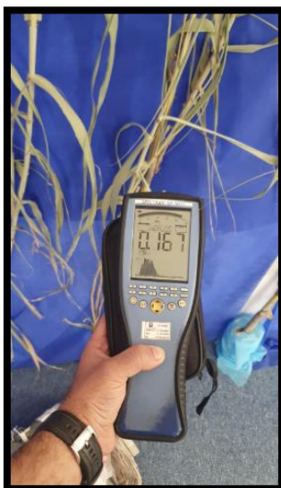
תמונה מס'2- הערך הנמדד לאורך קיר צד מזרח אמצע