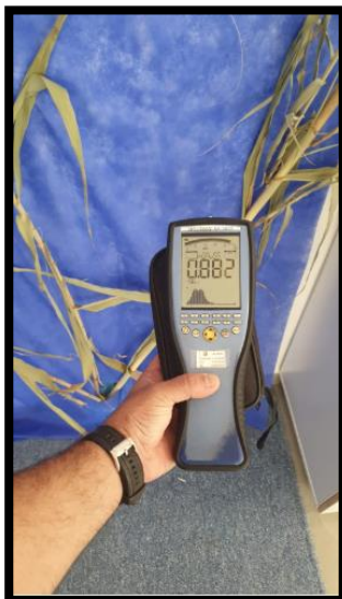
תמונה מס'3- הערך הנמדד לאורך קיר צד מזרח צד ימין