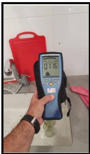
תמונה מס'5- הערך הנמדד לאורך קיר צד מזרח מטבח