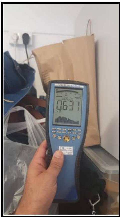
תמונה מס' 2: גב לוח חשמל מסדרון לממד