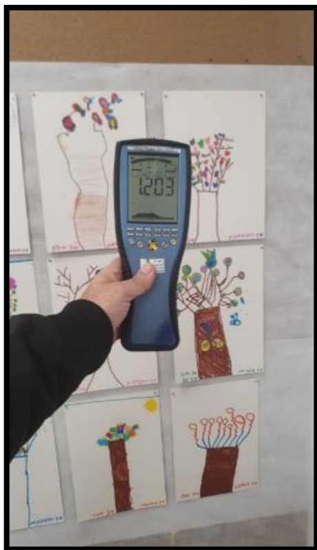
תמונה מס'2-הערך המתקבל בגב לוח חשמל מסדרון מעבר