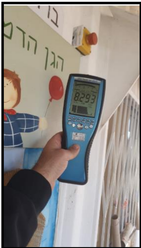
תמונה מס' 2-גב לוח חשמל מבואה מעבר