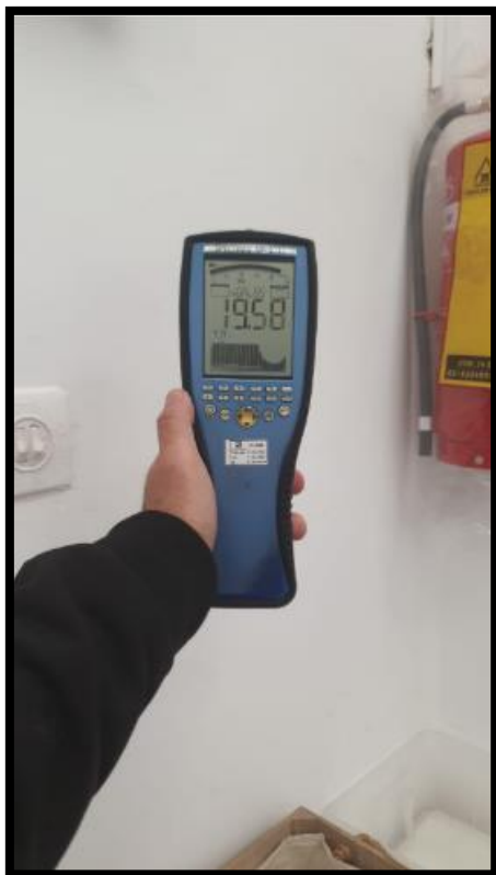
תמונה מס'2-הערך המתקבל בגב לוח חשמל מסדרון מעבר