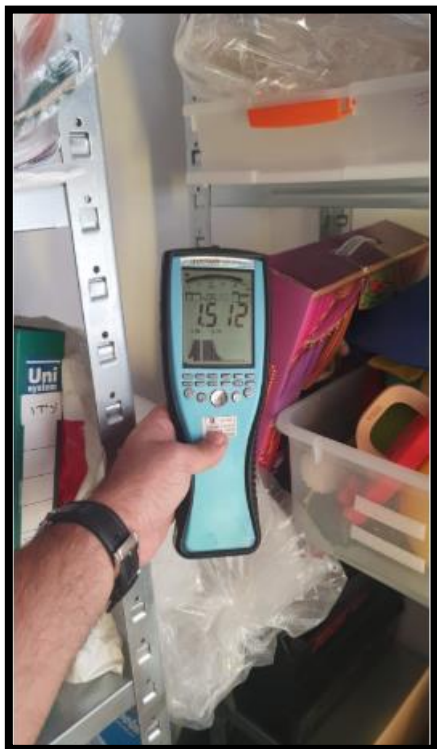
תמונה מס' 2: גב לוח חשמל