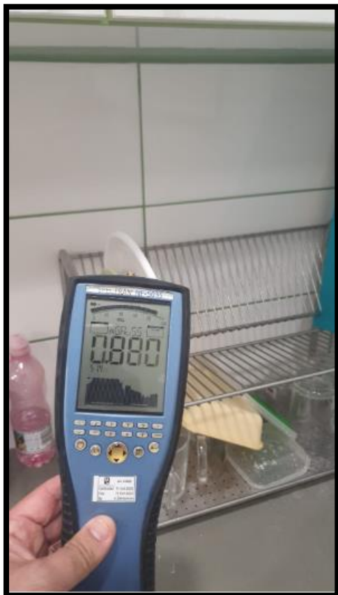
תמונה מס' 2: גב לוח חשמל מטבחון