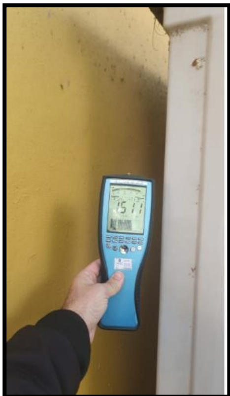
תמונה מס' 2-גב לוח חשמל מעטפת חיצונית