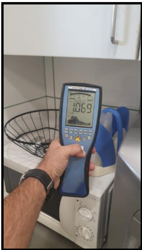
תמונה מס' 2: גב לוח חשמל מטבחון