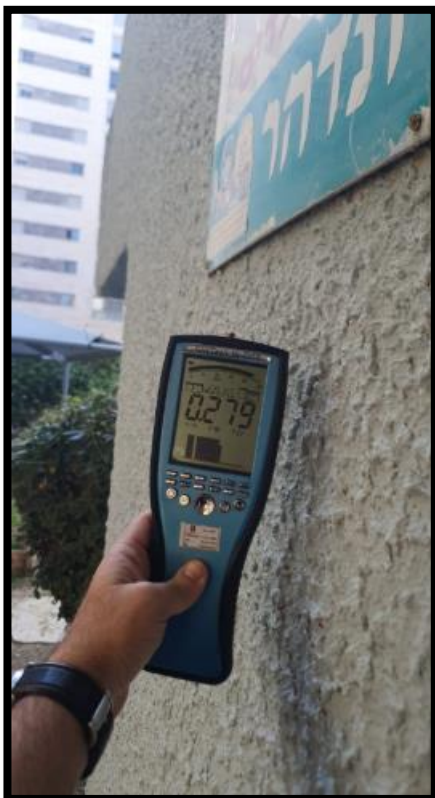
תמונה מס' 2- הערך המתקבל גב לוח חשמל