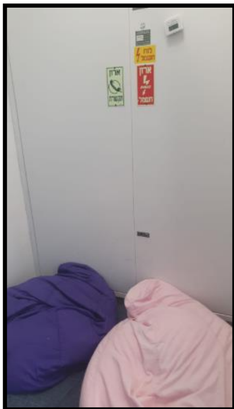
תמונה מס' 2-מבט ללוח חשמל