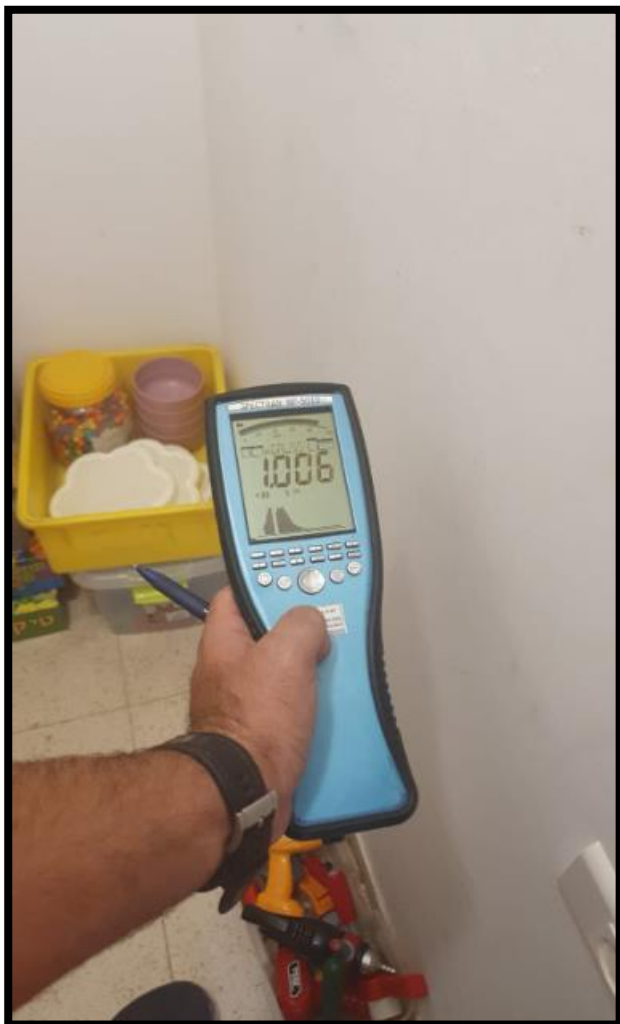
תמונה 2: הערך הנמדד במרחק 30 ס"מ מגב לוח חשמל