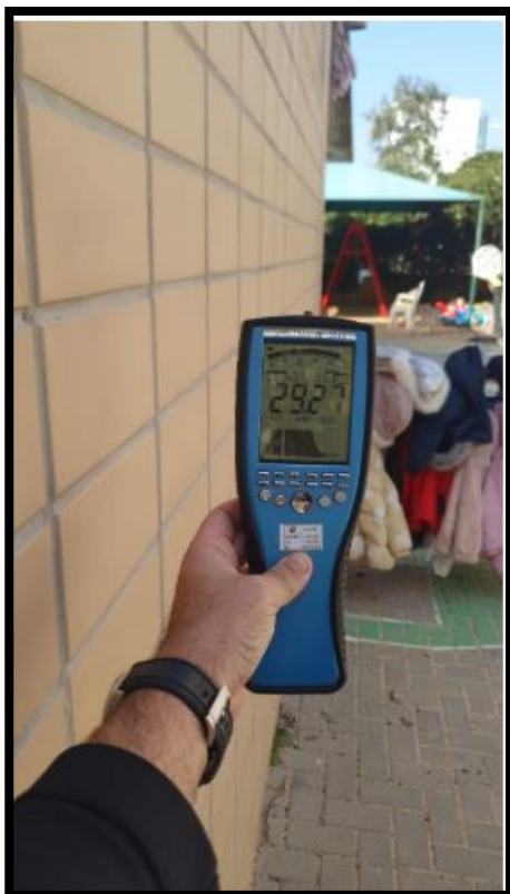
תמונה מס' 2- הערך המתקבל גב לוח חשמל