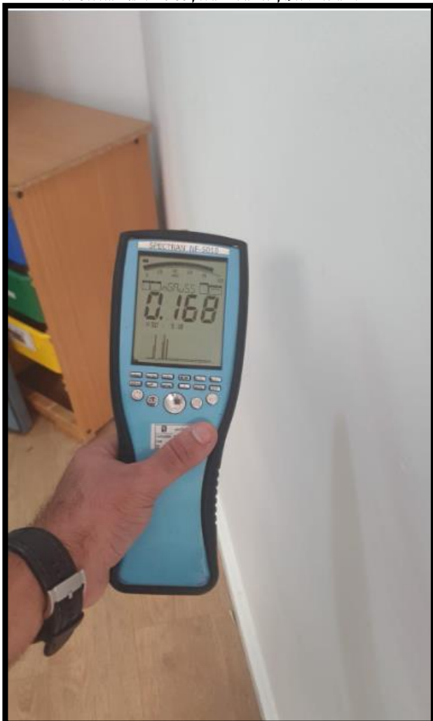
תמונה 2: הערך הנמדד במרחק 30 ס"מ מגב לוח חשמל