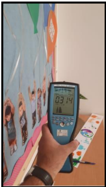
תמונה מס' 2: גב לוח חשמל