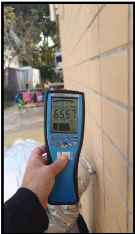
תמונה מס'2- הערך המתקבל גב לוח חשמל