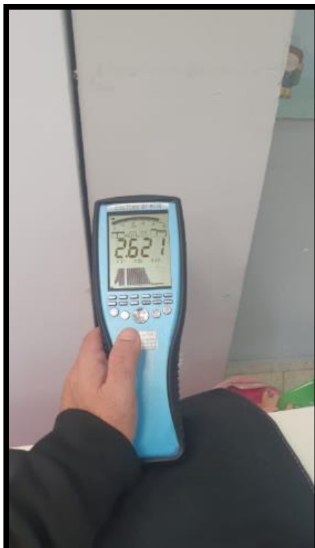
תמונה מס' 2-הערך המתקבל גם לוח חשמל במרחק 30 ס"מ