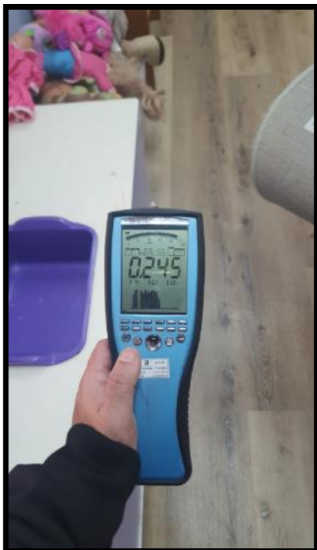
תמונה מס' 3-רמות רקע