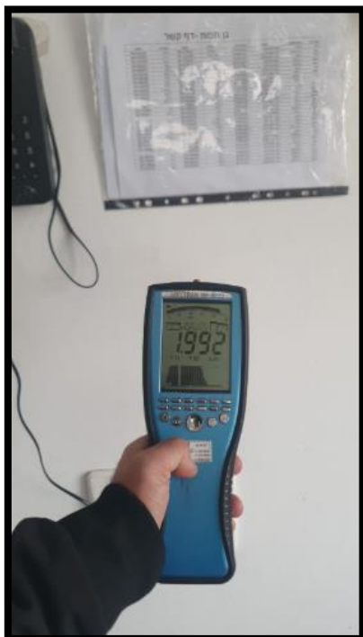
תמונה מס' 3-הערך המתקבל גב לוח חשמל