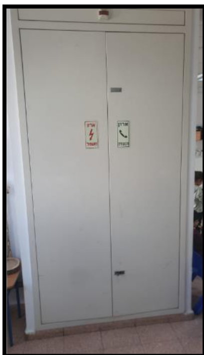
תמונה מס' 2-מבט ללוח חשמל