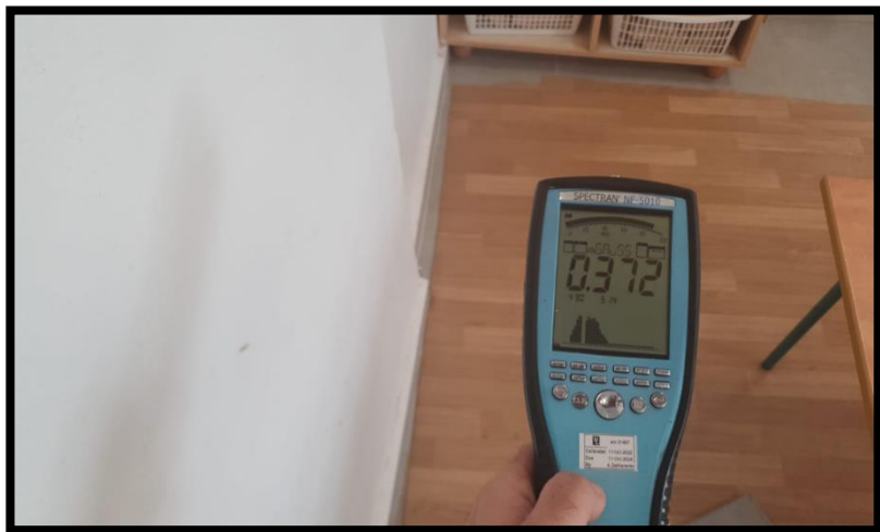
תמונה 2: הערך הנמדד במרחק 30 ס"מ מגב לוח חשמל דאחר מיגון קרינה