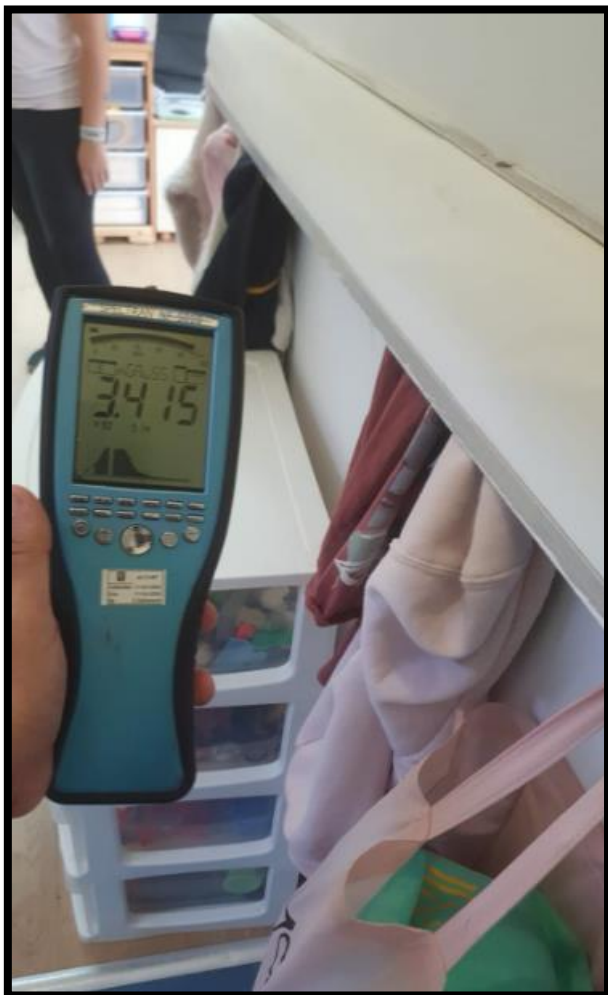
תמונה 2: הערך הנמדד במרחק 30 ס"מ מגב לוח חשמל