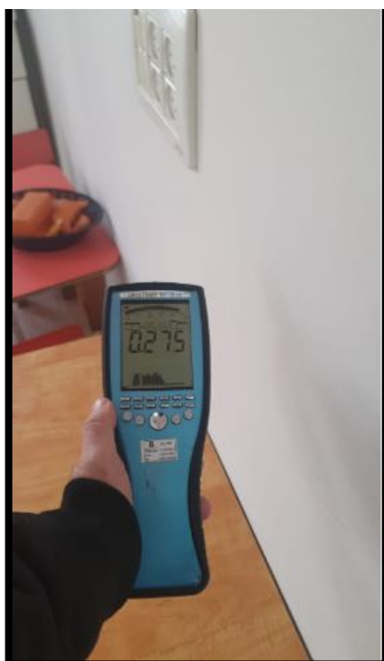
תמונה מס' 4-הערך המתקבל גב לוח חשמל