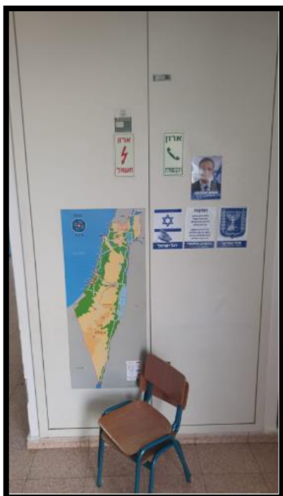
תמונה מס' 2-מבט ללוח חשמל