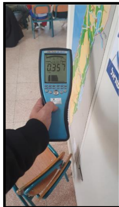
תמונה מס' 1-הערך המתקבל חזית לוח חשמל