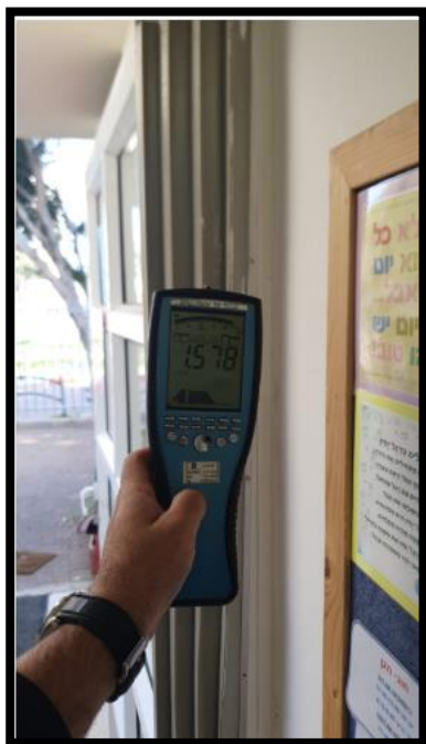
תמונה מס' 2-הערך המתקבל גב הלוח-מעבר