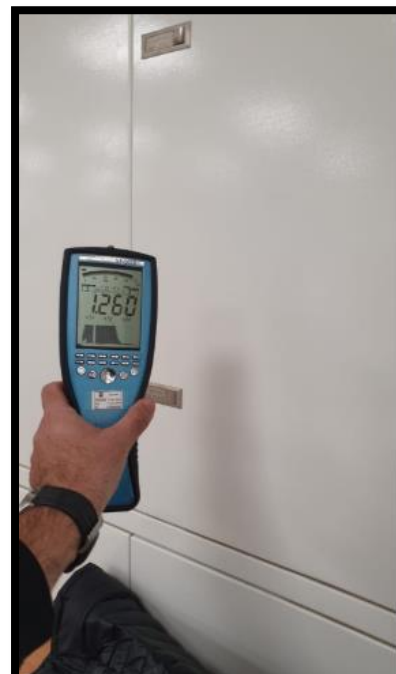
תמונה מס' 1-הערך המתקבל חזית הלוח