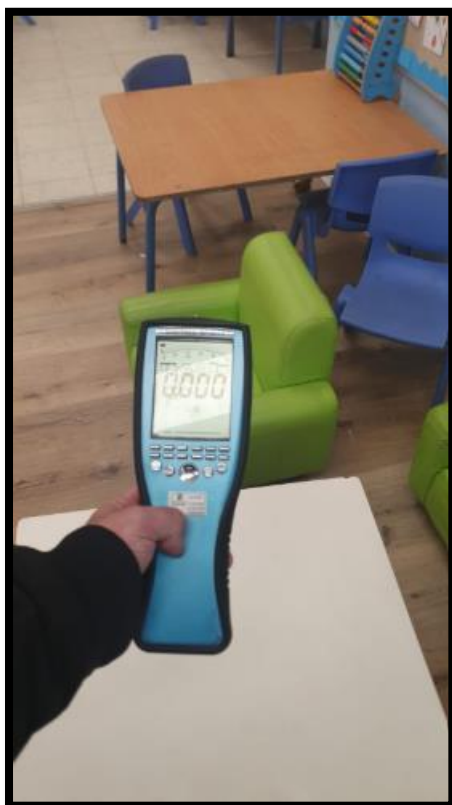
תמונה מס' 2-רמות רקע