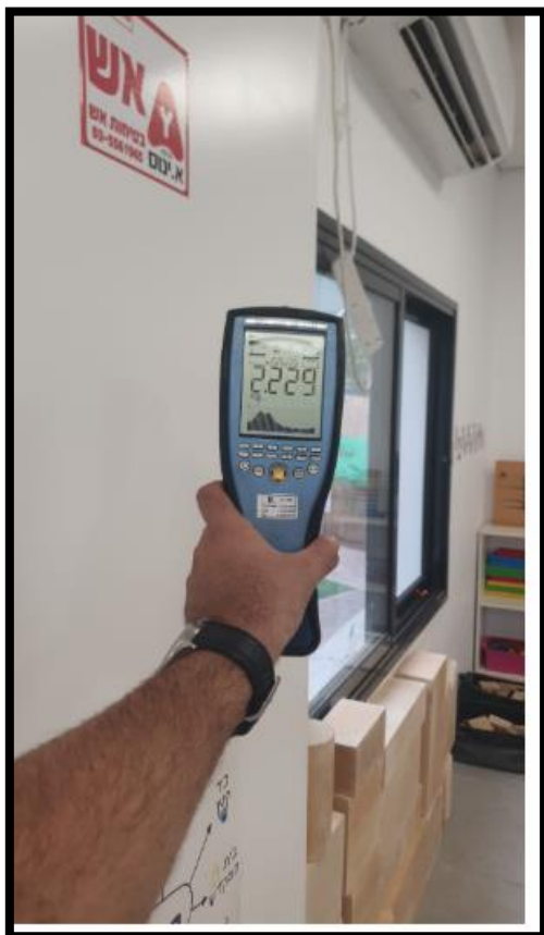
תמונה מס' 2: חזית לוח חשמל