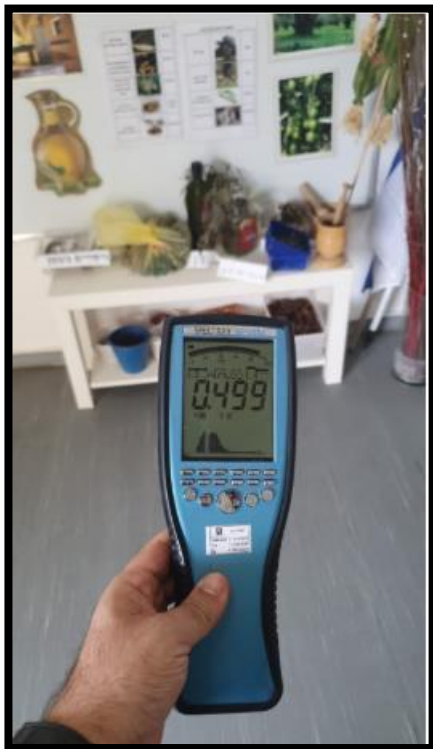
תמונה מס' 2: הערך שנמדד בחלל הגן