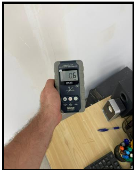
תמונה 2: הערך הנמדד במרחק 30 ס"מ מגב לוח חשמל