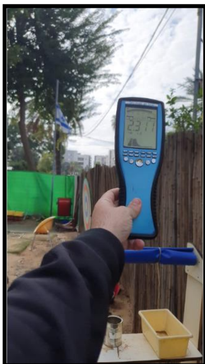
תמונה מס' 6: הערך התקבל בחצר לאורך קווי החשמל מצד מערב