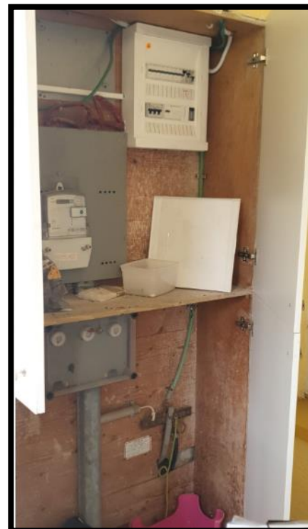
תמונה מס' 1: חזית לוח חשמל