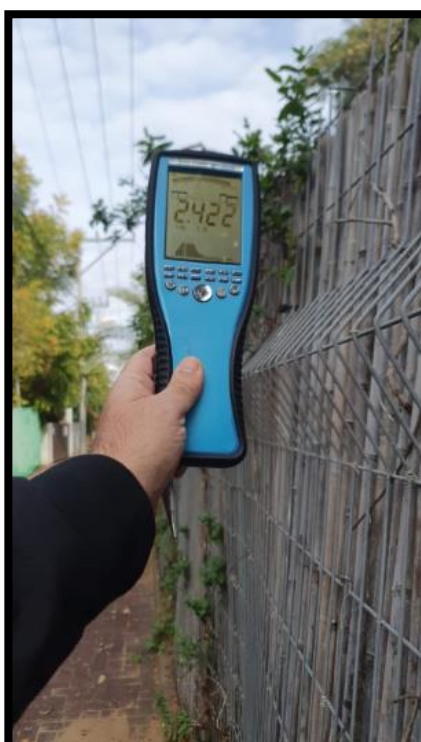
תמונה מס' 2: הערך המתקבל לאורך קווי חשמל צד מערב