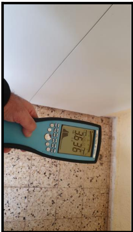
תמונה מס' 3: הערך המתקבל במרחק 30 ס"מ מחזית הלוח