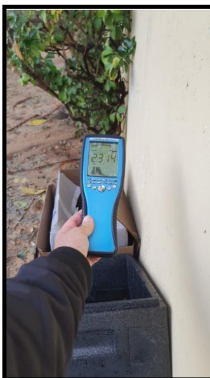
תמונה מס' 5: הערך המתקבל גב לוח חשמל