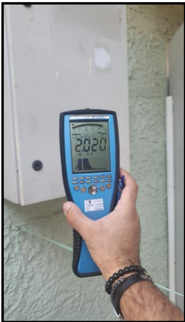
תמונה 2: גב לוח חשמל