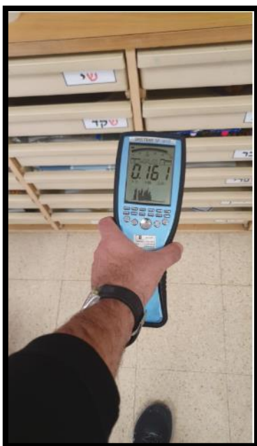
תמונה מס' 2-הערך המתקבל במרחב הגן