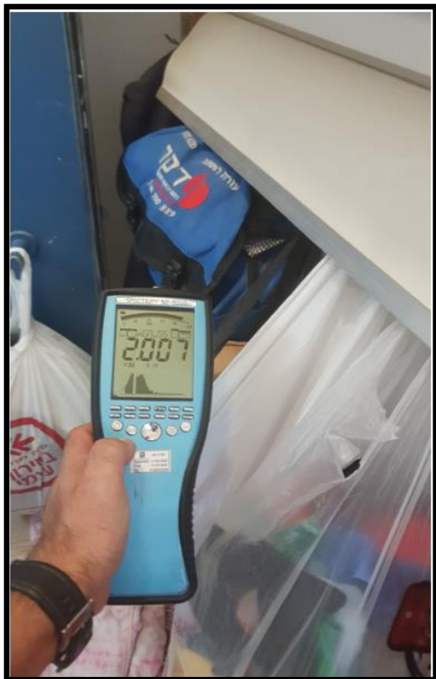
תמונה 2: הערך הנמדד במרחק 30 ס"מ מגב לוח חשמל