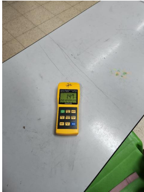
ערך מתקבל בכיתה ג'2