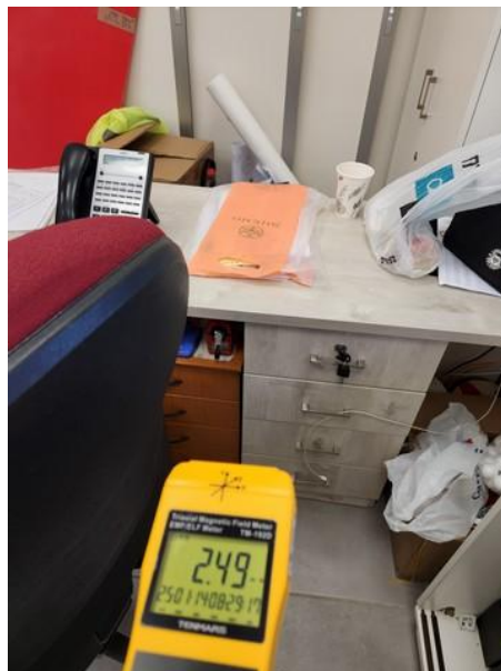
ערך מתקבל בפרוזדור קומה 1