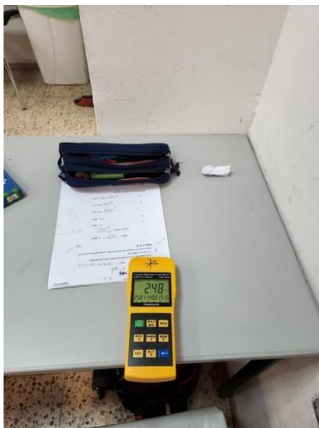
ערך מתקבל בכיתה 29 קומה 1