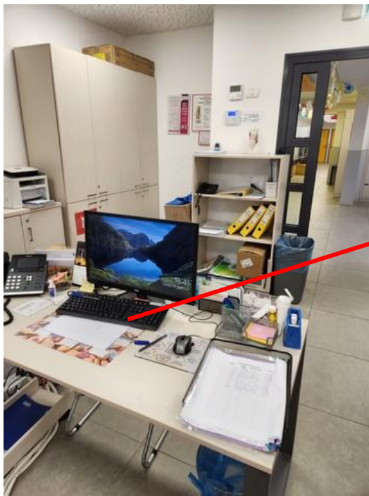
כיתה 21 מועדון חברותא